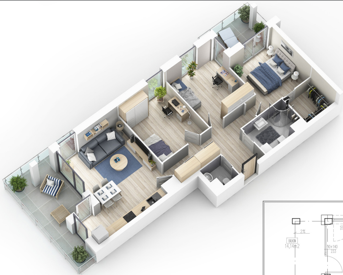
M 78 (4PK) PU=74,37m 2